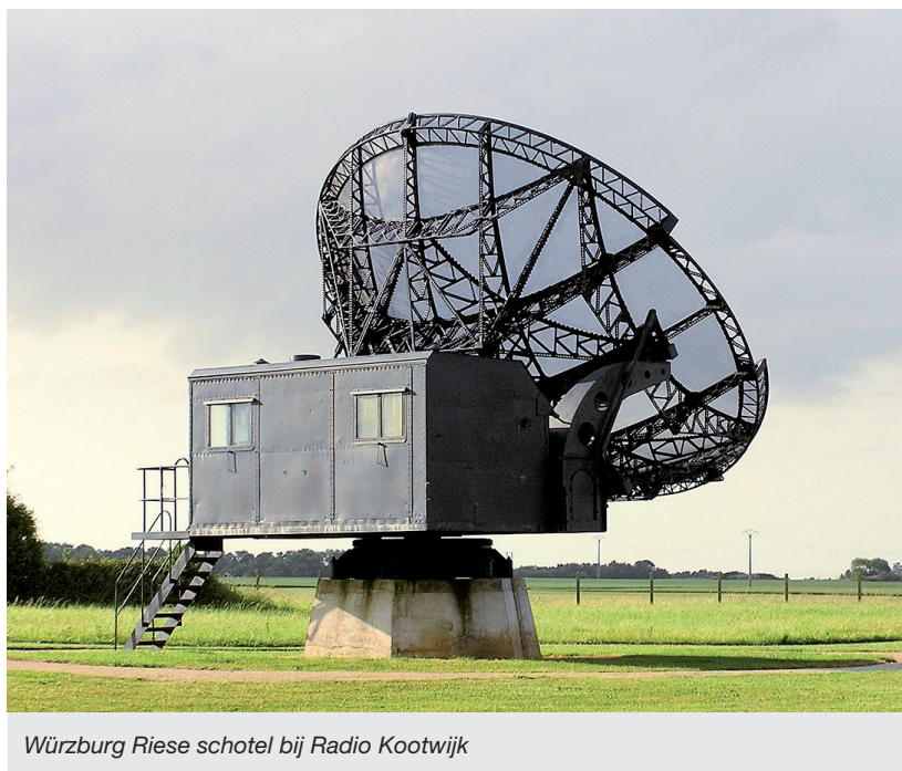
Würzburg Riese schotel bij Radio Kootwijk