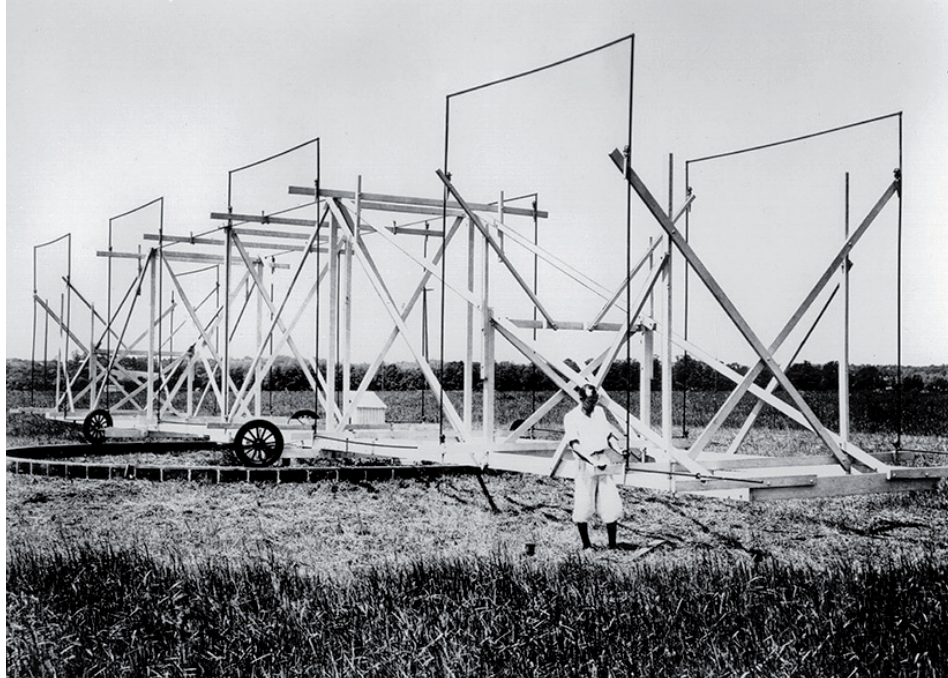
Zelfgebouwde draaibare antenne van Karl Jansky